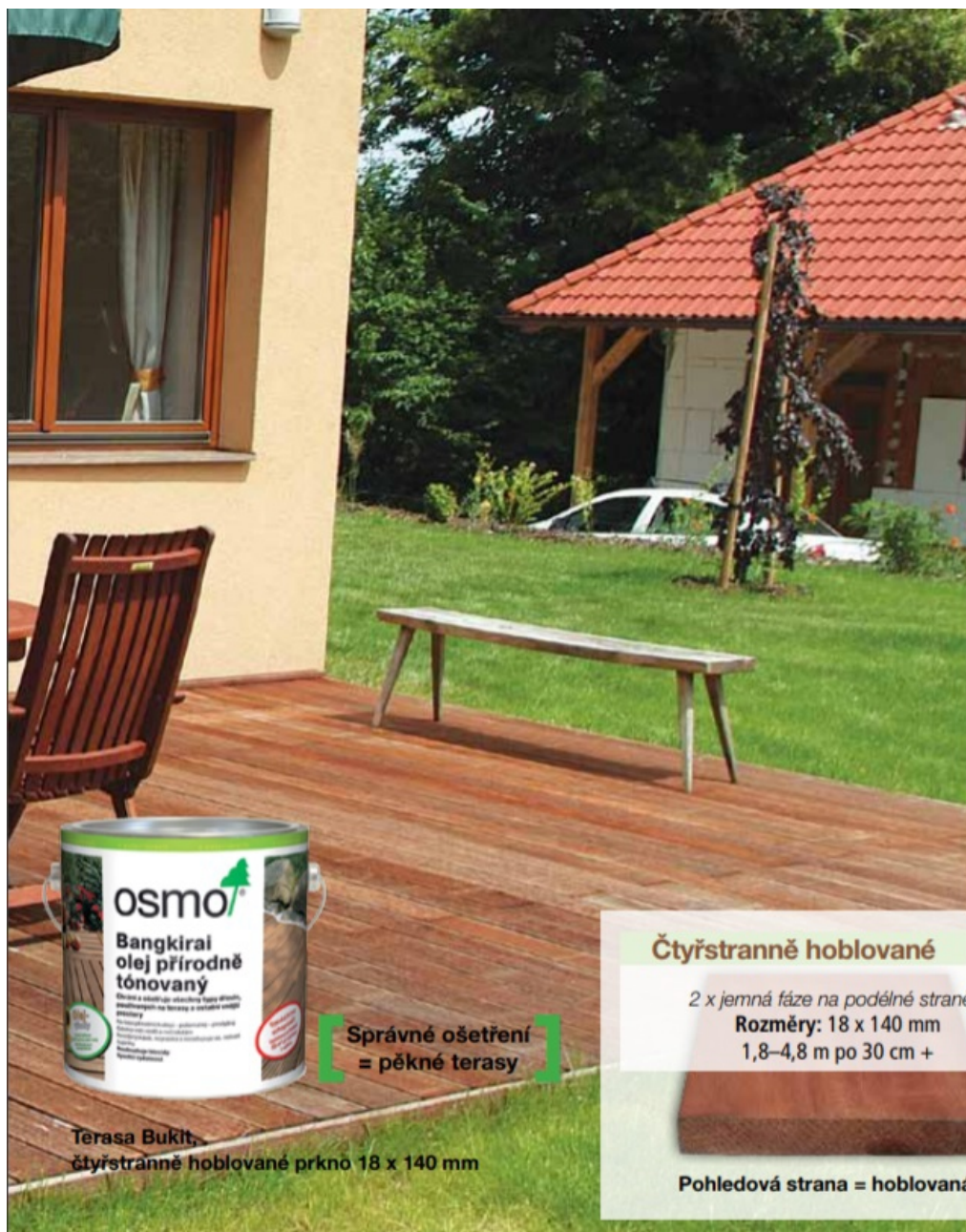
Terasa Bukit, čtyřstranně hoblované prkno 18 x 140 mm