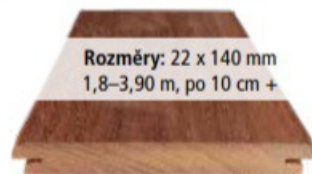
Pohledová strana = hladká