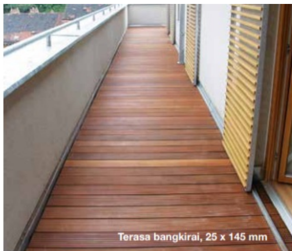
Terasa bangkirai, 25 x 145 mm

Terasy z dřeviny Bangkirai dodáváme vzduchosuché s vlhkostí do 25%. Jádrové dřevo má v čerstvém stavu žlutohnědý až nazelenalý vzhled, často ale ztmavne v olivově hnědou. Barevné rozdíly mezi jednotlivými prkny jsou přirozené a obvyklé. Jako jedno z nejdolnějších dřev vykazuje jádrové dřevo, které se ne vždy zbaví světlejší běli, vysokou odolnost proti plísni a hmyzu. Letokruhy nejsou znatelné, suché dřevo je bez zápachu. Ve dřevě se mohou vyskytnout otvory od hmyzu, které však neovlivňují trvanlivost a statické vlastnosti. Dřevo je velmi tvrdé a má dlouhou životnost díky vysoké hustotě a obsaženým látkám. Tyto olejnaté obsažené látky mohou být během první fáze vystavení povětrnostním podmínkám vyplaveny deštěm. Z toho důvodu musí být dřevo umístěné na terasách či balkonech použito tak, aby voda stékající ze dřeva byla odvedena okapy a dešťovými žlaby. Plocha terasy by se měla upravit olejem ca. 2–3 měsíce po pokládce, kdy dojde k přirozenému úbytku obsažených látek ze dřeva. Bez provedení ošetření zůstává dřevo bez újmy a časem se vytvoří na povrchu dřeva šedo–stříbrná patina. S OSMO Terasovým olejem můžete dřevo na dlouhou dobu opticky zhodnotit. Pro správnou funkčnost terasy je bezpodmínečně nutné dodržet základní pravidla pro pokládku dřevěných teras a vytvoření dostatečně stabilní podkladní konstrukce. Pro podkladní konstrukci má být kvůli rovnoměrnému nabobtnání a smršťování použito pouze