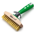
Kartáč k čištění teras s držákem