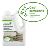
Gard Clean - Odstraňovač zeleného povlaku

Používejte biocidy bezpečným způsobem. Před použitím si vždy přečtěte označení a informace o přípravku.